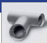
IN CLAD трійники сірі