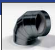
IN CLAD кути чорні