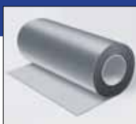
IN CLAD сіре покриття