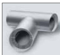
IC CLAD трійники сріблясті