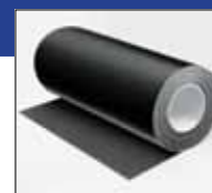
IN CLAD чорне покриття