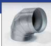
IN CLAD кути сірі