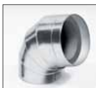
IC CLAD кути сріблясті