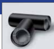
IN CLAD трійники чорні