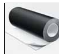
IC CLAD чорне покриття