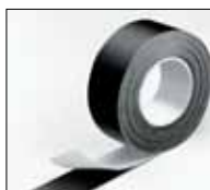
IC CLAD стрічка чорна