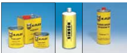
Клей, герметик, очищувач

Для додаткової інформації зайдіть на сайт: www.k-flex.ua