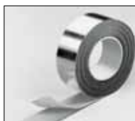
IC CLAD стрічка срібляста