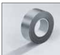
IN CLAD стрічка сіра