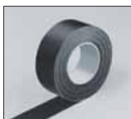
IN CLAD стрічка чорна