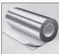
IC CLAD сріблясте покриття